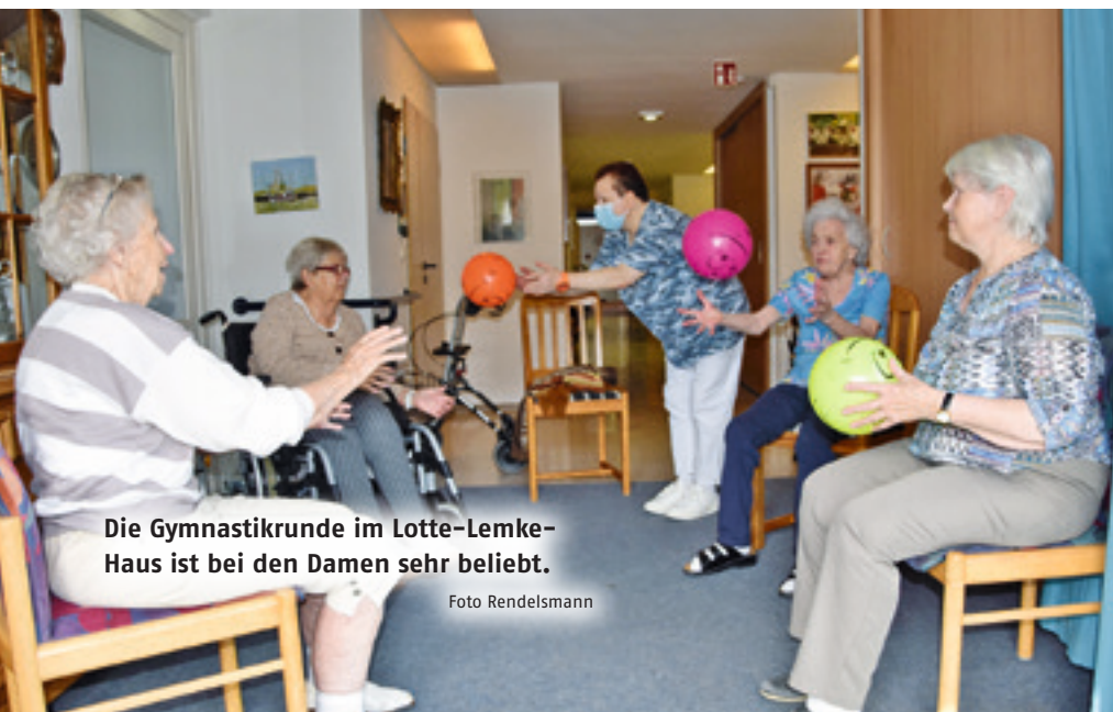
Die Gymnastikrunde im Lotte-Lemke-Haus ist bei den Damen sehr beliebt.

Hygienekonzepte, Besuchsregelungen, Absprachen mit Gesundheitsamt und Krisenstab, Verordnungen mit unterschiedlichen Bestimmungen für die Bundesländer Bremen und Niedersachsen – die Corona-Pandemie hat allen mit der Pflege Befassten alles abverlangt. „Natürlich waren es bewegende Situationen während der Besuchseinschränkungen – aber wir mussten und müssen auch heute noch stets abwägen zwischen dem Wunsch, Begegnungen zu ermöglichen und dem Schutz unserer Bewohner*innen und auch dem Schutz unserer Mitarbeitenden vor einer Corona-