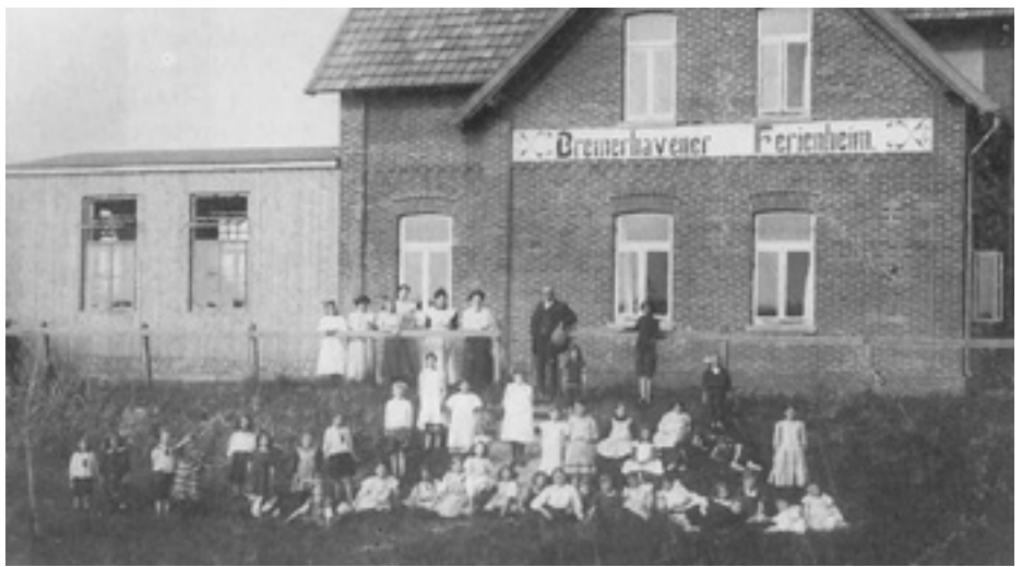
Die AWO Bremerhaven machte es sich zur Aufgabe, Ferienbetreuung für Kinder und Jugendliche in Bremerhaven und Wesermünde zu organisieren.

Eröffnung einer Beratungsstelle für jugoslawische Mitbürger*innen.