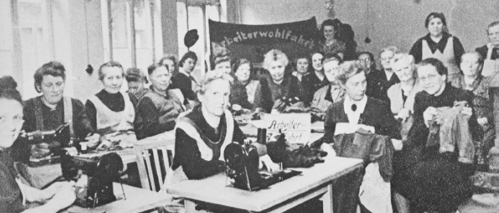
Die Nähstube an der Deichstraße ist die erste Einrichtung der AWO in Bremerhaven.