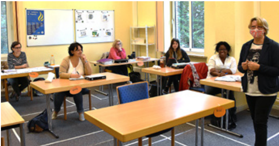
In der Altenpflegeschule Ursula-Kalkstein-Akademie wird der pflegerische Nachwuchs ausgebildet – ab 2021 in der Generalistischen Ausbildung.

Infektion“, sagt Heike Bülken, „und dieser Weg ist – mit Blick auf die aktuellen Entwicklungen der Infektionszahlen – noch nicht zu Ende.“ (ThK)